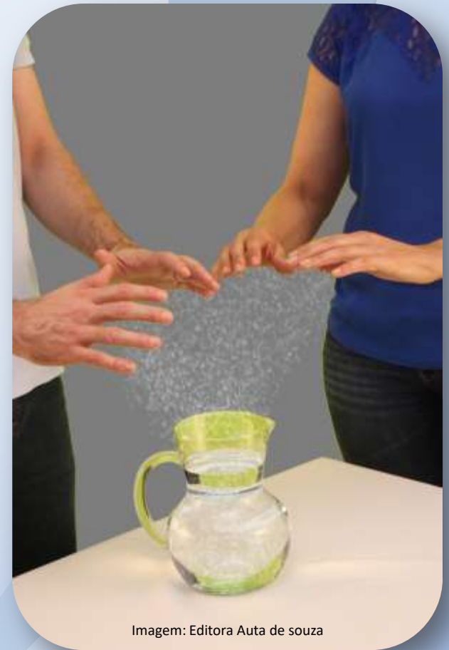
Imagem: Editora Auta de souza

(Deleuze. Histoire critique du magnétisme animal, 1813, p.120)