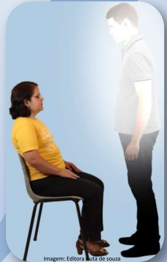
Imagem: Editora Luta de souza

“[...] todas as pessoas dignas e fervorosas, com o auxílio da prece, podem conquistar a simpatia de veneráveis magnetizadores do Plano Espiritual [...].”