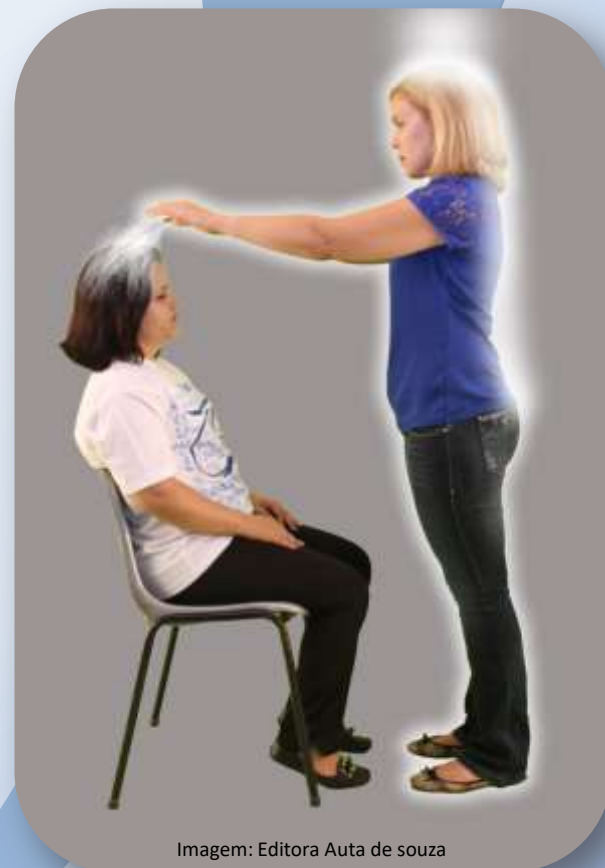
Imagem: Editora Auta de Souza

- Ainda aqui – disse Áulus -, não podemos subestimar a importância da mente. O pensamento influi de maneira decisiva, na doação de princípios curadores. Sem a ideia iluminada pela fé e pela boa-vontade, o médium não conseguiria ligação com os Espíritos amigos que atuam sobre essas bases.”