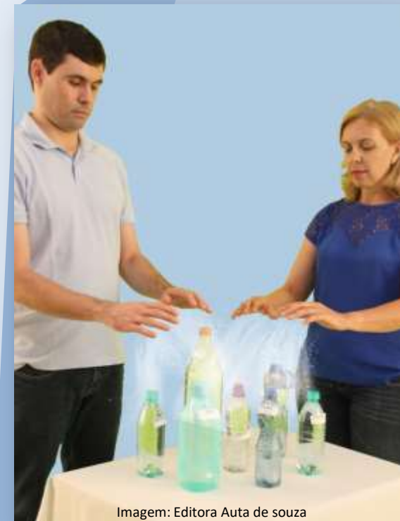
Imagem: Editora Auta de souza

O Espírito atuante é o do magnetizador, quase sempre assistido por outro Espírito. Ele opera uma transmutação por meio do fluido magnético. ” (Allan Kardec. O livro dos médiuns , item 130-131)